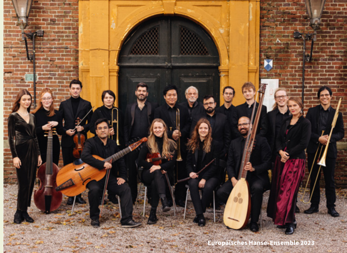
Europäisches Hanse-Ensemble 2023