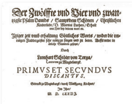
Leonhart Schröter, Der Zwölfte und Vier und zwanzigste Psalm Davids (Magdeburg 1576)

Grimm legte seine handschriftlich überlieferte, ganz auf Klanglichkeit orientierte