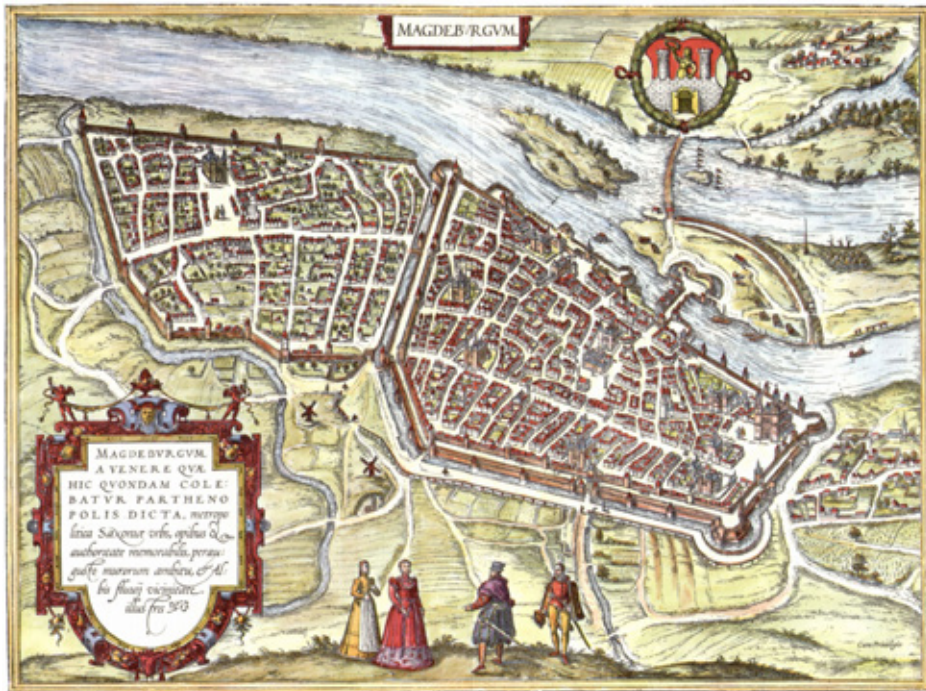
Magdeburg 1572, Frans Hogenberg (vor 1540–1590)