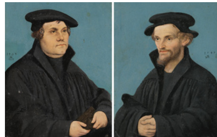
Martin Luther und Philipp Melanchthon, 1543