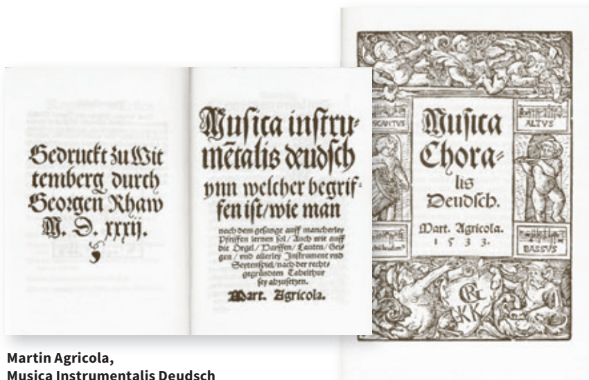
Martin Agricola, Musica Instrumentalis Deusch (Wittenberg 1529)