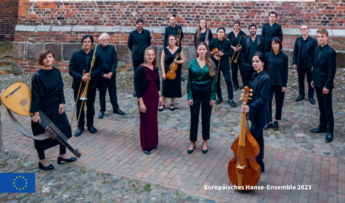
Europäisches Hanse-Ensemble 2023